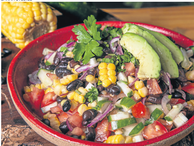
Costarriquenho do Oby Sabores Orgânicos