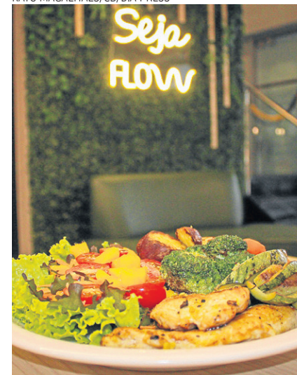
Prato frango fit flow do restaurante Flow Fresh To Go

cozidos, batata doce e salada. “Para nossos foliões de Brasília, recomendamos um prato leve e que sacia muito bem, além de não pesar muito a digestão para curtir a folia”, observa Lucas.