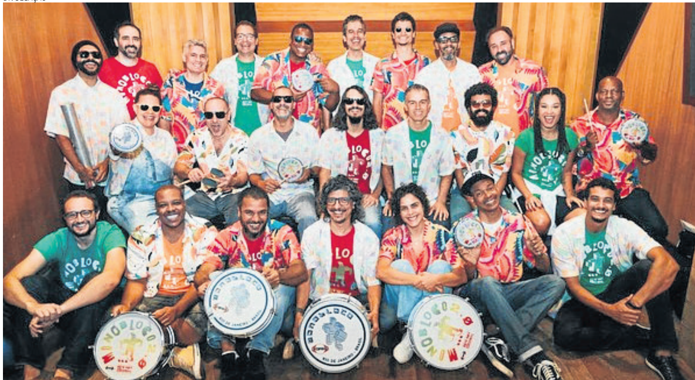
O grupo escolheu, para este ano, o tema Toca esse tambor

O grupo carioca Monobloco desembarca na cidade com a bateria poderosa para agitar o carnaval candango