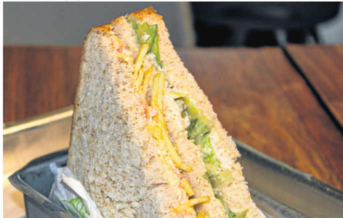
Sanduíche de salpicão de frango do Salad Bowl

O proprietário acredita que o ideal para os foliões é apostar em comidas mais leves e balanceadas e, para isso, sugere a nova linha de sanduíches naturais da casa, dando destaque ao sabor frango com guacamole