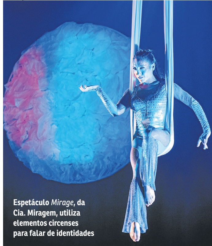
Espectáculo Mirage , da Cia. Miragem, utiliza elementos circenses para falar de identidades

Paraísos Tropicais. A companhia toma emprestado do universo do circo a lira, tecidos, cordas, faixas e outros instrumentos de acrobacias aéreas para trabalhar a experiência de estar fora do chão.