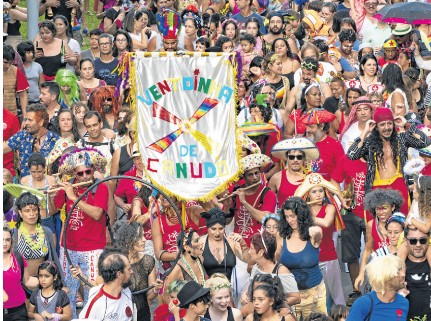
O bloco Ventoinha de Canudo celebra duas décadas de carnaval

Brasília. Atraindo pessoas de todas as idades, a festa arrasta milhares de pessoas por trás da Matriz da Caixa Econômica Federal, seguindo no sentido EQS 403/203, subindo na CLS 203/204, sentido eixo norte, depois descendo na CLS 201/202 e, finalmente, chegando na concentração atrás da matriz caixa.