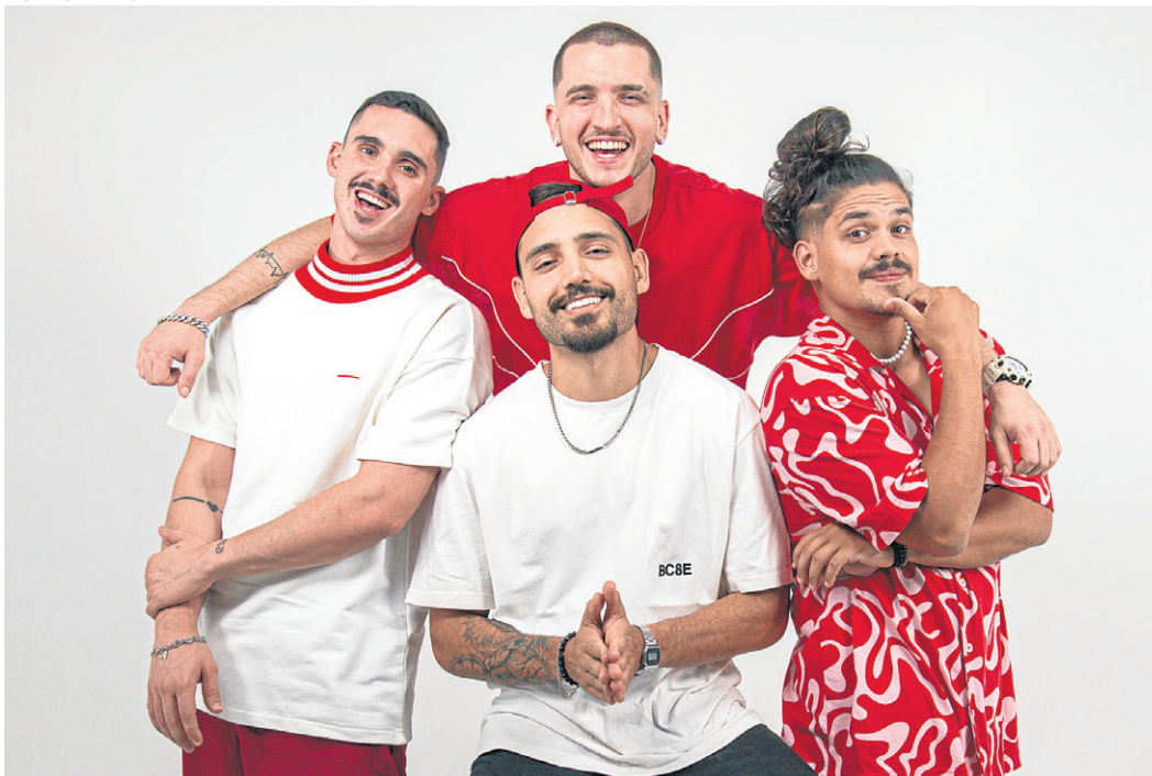
Grupo de pagode Doze por Oito: em conexão com o carnaval

Doze por Oito e toda a energia do período de carnaval.