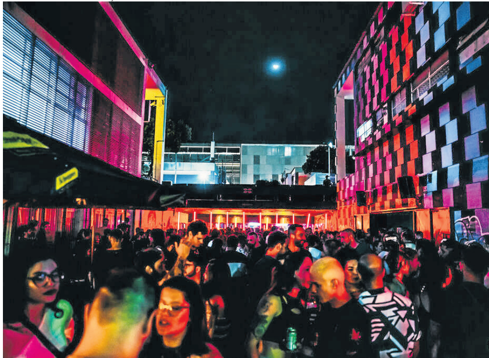
Externa club, um dos grandes pontos de encontro do carnaval da juventude brasiliense