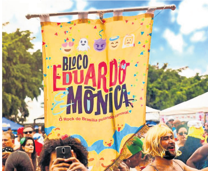
Bloco Eduardo e Mônica agita a folia candanga em ritmo de rock