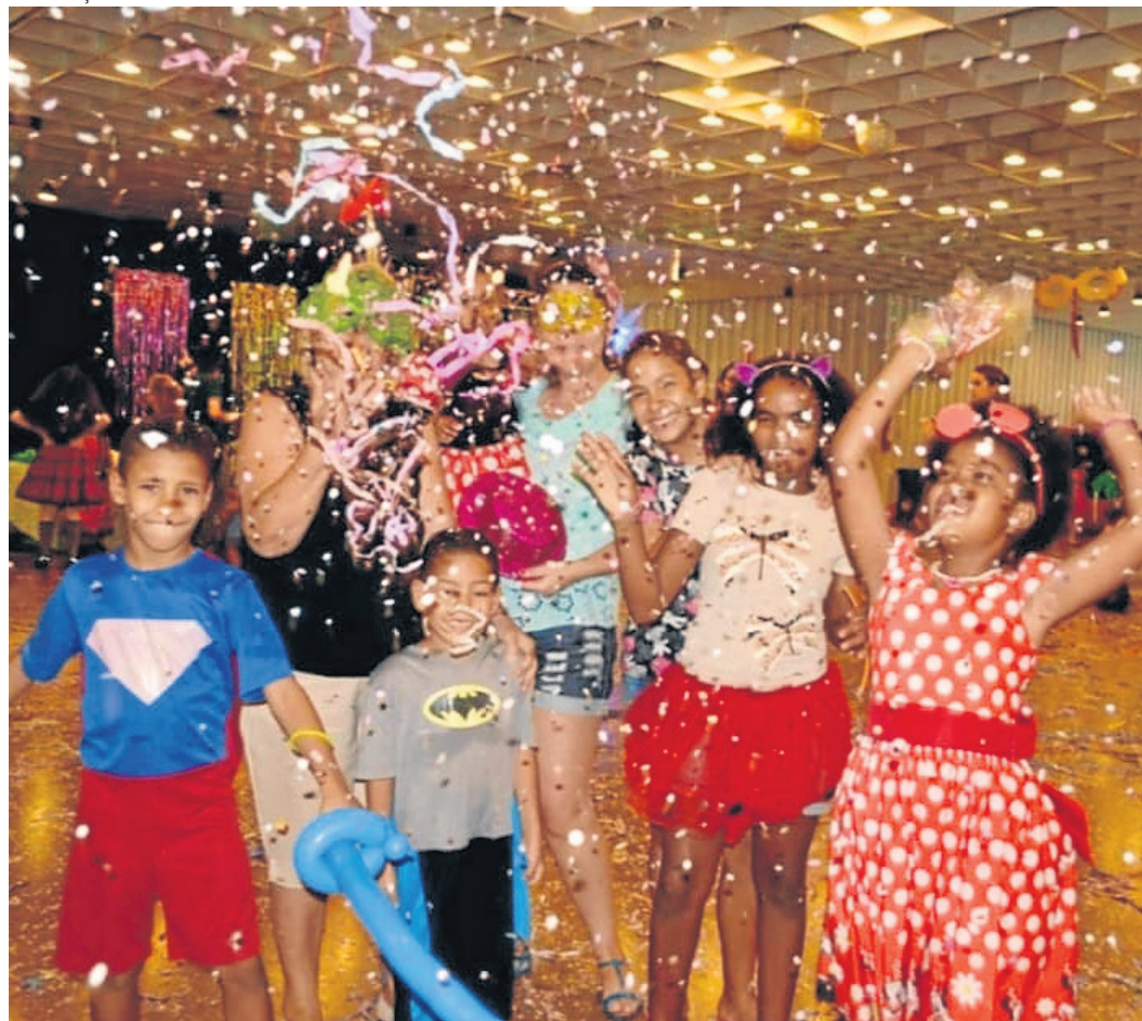
Bailinho de carnaval para as crianças